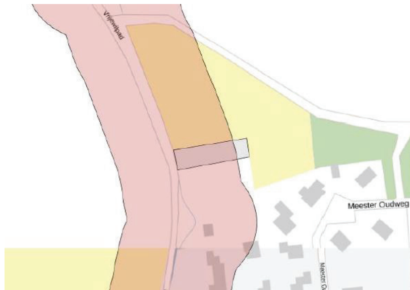
Kaart beschermingszone hoofdwatergang

Voor het plan is op 9 januari 2018 een digitale watertoets aangevraagd bij Wetterskip Fryslan. Uitkomst van de watertoets is de normale watertoetsprocedure, omdat het plan binnen de beschermingszone van een hoofdwatergang ligt (zie onderstaande afbeelding).